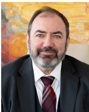
François BRAUN Ministre de la Santé et de la Prévention