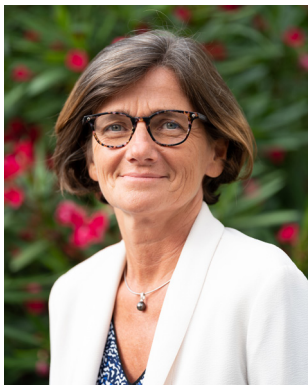
Agnès FIRMIN LE BODO Ministre déléguée chargée de l'Organisation territoriale et des Professions de santé

L'accès à des soins de qualité, partout sur le territoire, pour tous nos concitoyens, est au cœur de notre feuille de route au sein du ministère de la Santé et de la Prévention.