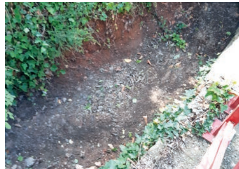
Chemin des Marquets