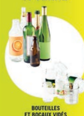
BOUTEILLES ET BOCAUX VIDÉS