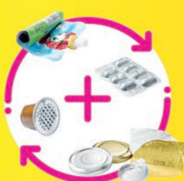
EMBALLAGES EN MÉTAL, MÊME LES PETITS