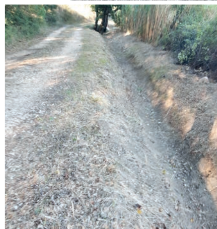
Hameau des Ferriers