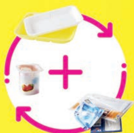
TOUS LES EMBALLAGES EN PLASTIQUE