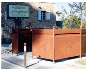
Avenue Dame Sirmonde

Merci à l'ensemble de l'équipe technique pour ces travaux et pour leur professionnalisme■