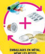
EMBALLAGES EN MÉTAL, MÊME LES PETITS