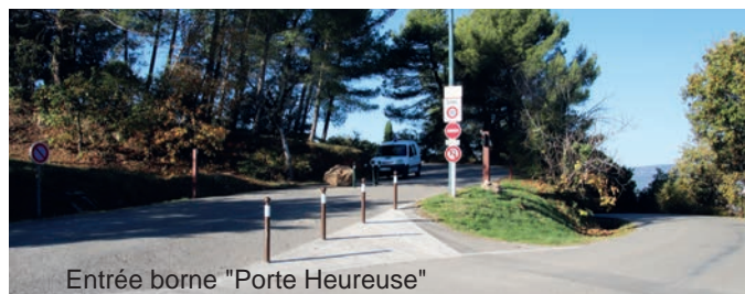
Entrée borne "Porte Heureuse"