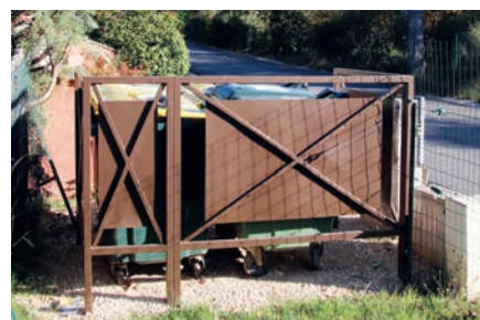
Chemin des Lombards