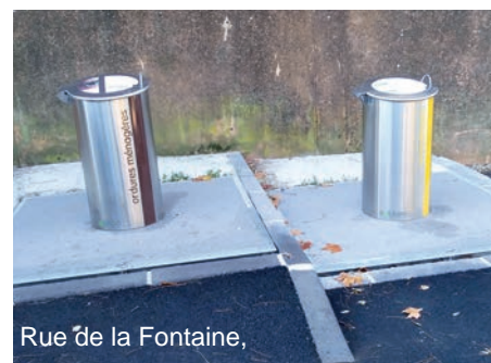
Rue de la Fontaine, (réalisé sous l'ancienne municipalité)