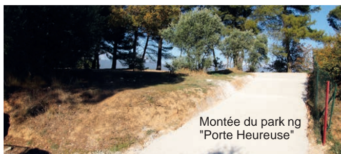
Montée du parking "Porte Heureuse"