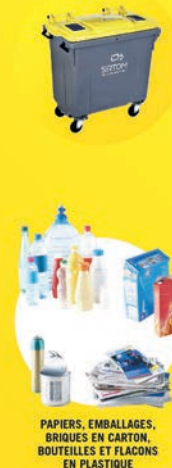
PAPIERS, EMBALLAGES, BRIQUES EN CARTON, BOUTEILLES ET FLACONS EN PLASTIQUE