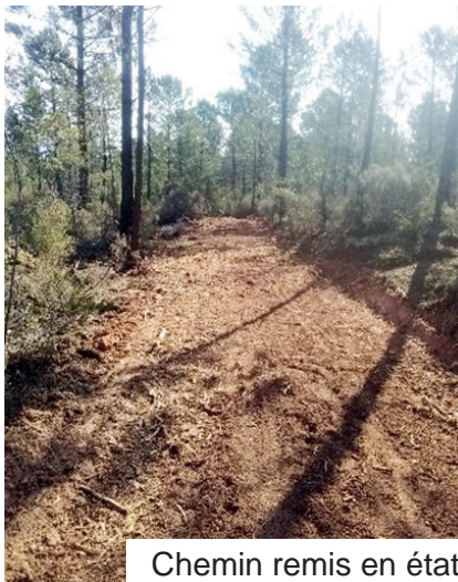
Chemin remis en état

Des représentants de la mairie de Roussillon et du Parc du Luberon sont venus contrôler et ont estimé que le chemin avait été correctement remis en état.