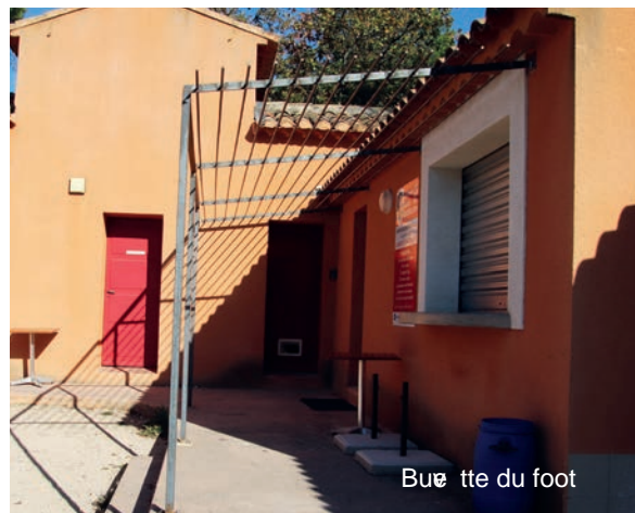
Buette du foot