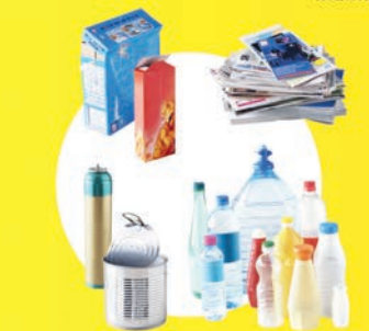
PAPIERS, EMBALLAGES, BRIQUES EN CARTON, BOUTEILLES ET FLACONS EN PLASTIQUE