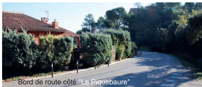
Bord de route côté "Le Piquebaure"